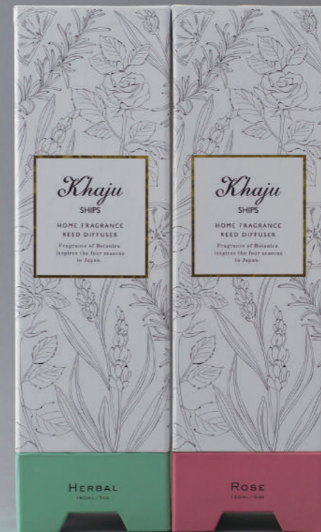
ドライフラワーディフューザー / Khaju ¥4,000 + 税 瓶の中にドライフラワーが入ったディフューザー。部屋のディスプレイにも最適。