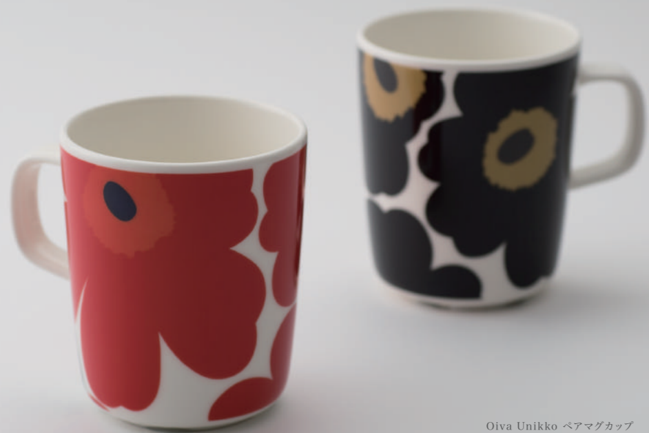
Oiva Unikko ペアマグカップ