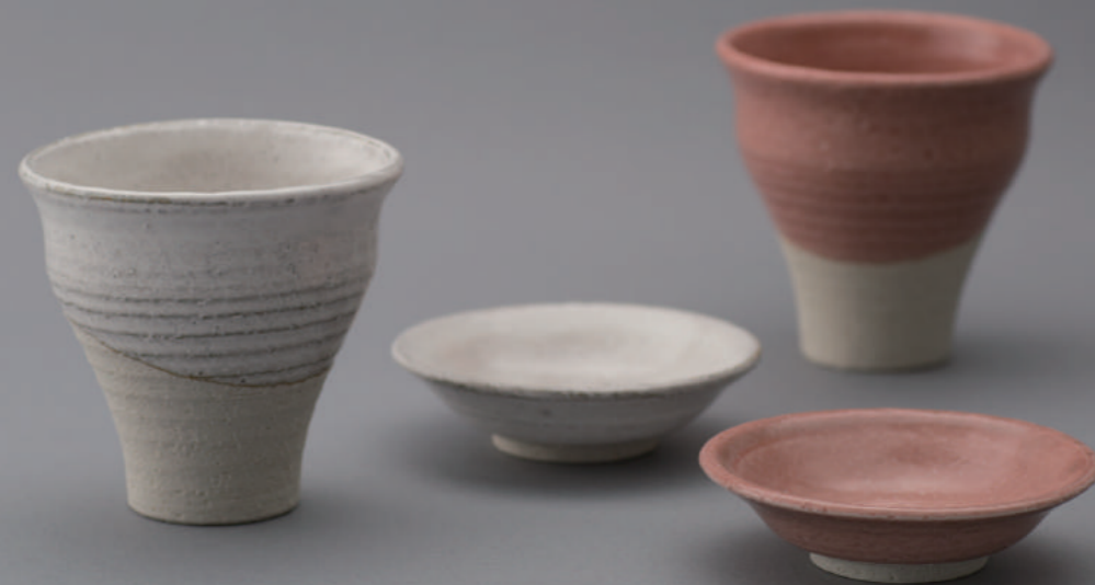
ことほぎ二人杯 ¥3,000 + 税 “言葉で祝う”“祝賀”の意の言葉「ことほぎ」と名付けたセット。 小皿にはお菓子やおつまみ、カップにはお茶やビール、コーヒーなど様々な組み合わせで楽しめます。