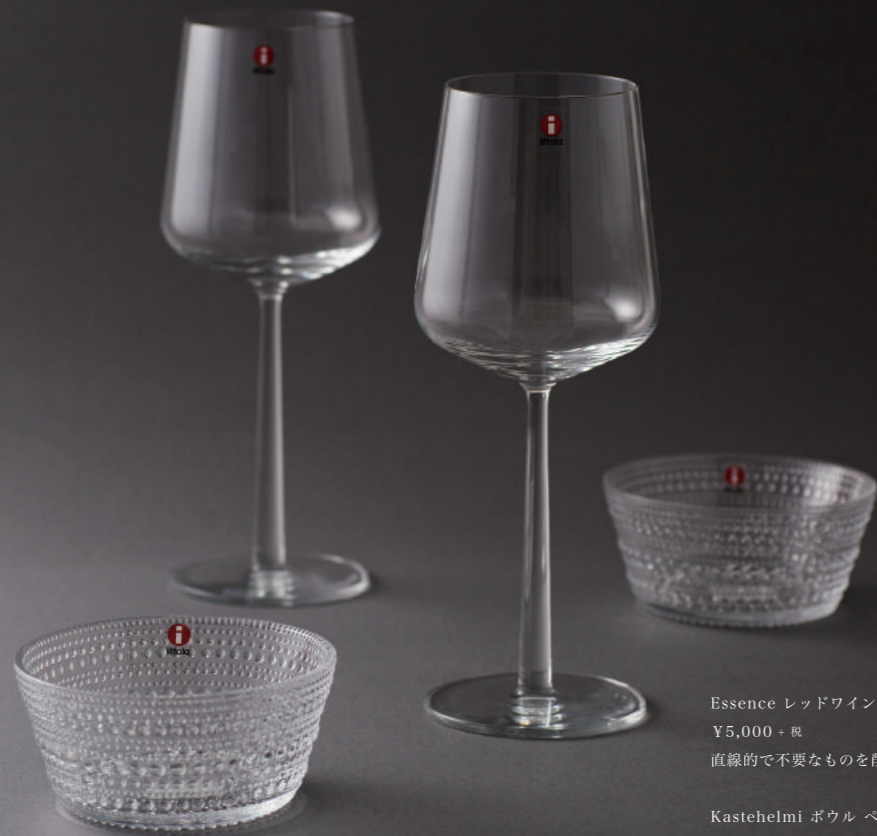
Essence レッドワイングラス ペアセット / iittala ¥5,000 + 税 直線的で不要なものを削ぎ落としたシンプルなデザインのワイングラス。