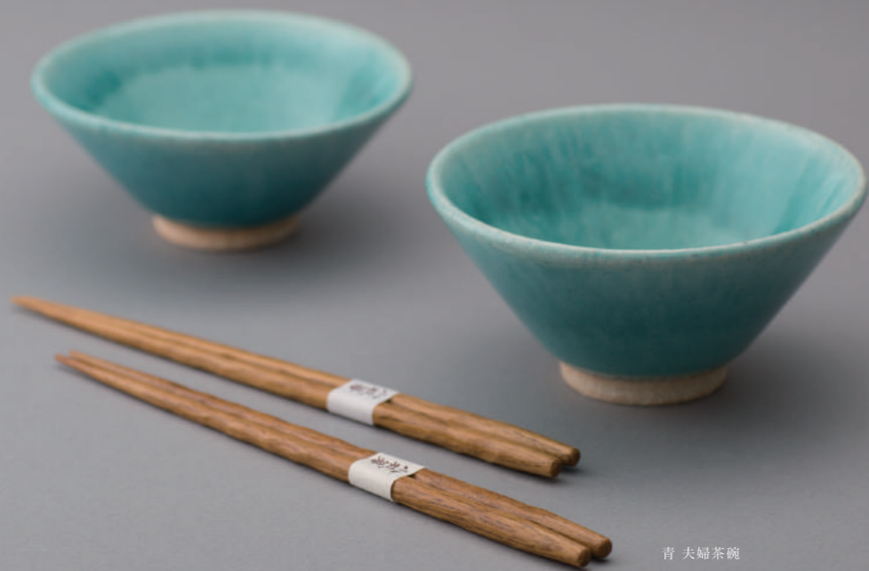
青 夫婦茶碗 ¥3,000 + 税 大小サイズ違いの飯碗と箸のセット。 目を惹く鮮やかなブルーはひとつひとつ風合いが違って表情豊かな色が人気。