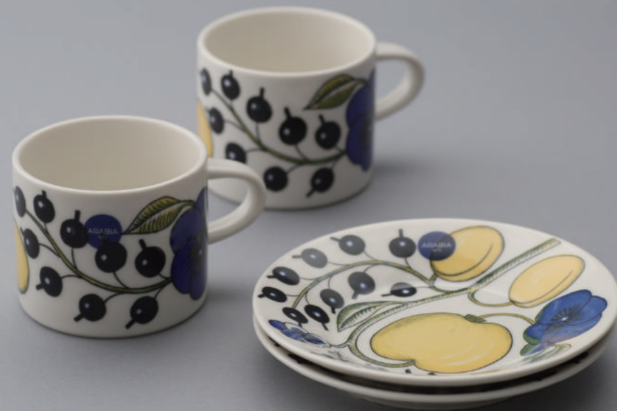
Paratiisi コーヒーカップ&ソーサー ペアセット ¥15,000 + 税 華やかなティータイムを演出できるカップ&ソーサー。