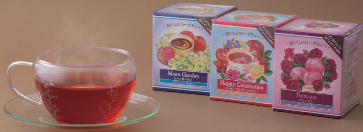
おいしいティータイムギフト