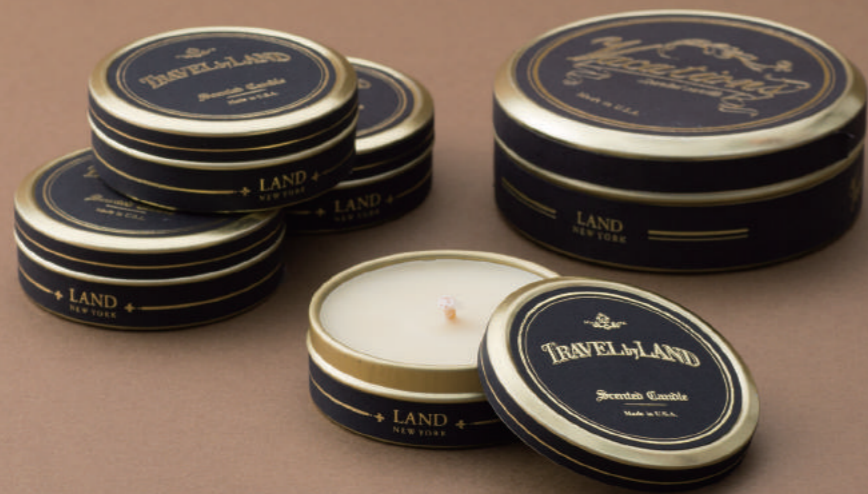
トラベル キャンドル / LAND BY LAND ¥1,900 + 税 アメリカ製のキャンドル。 旅行に持ち運べるサイズでの展開。香りも数種類あり。