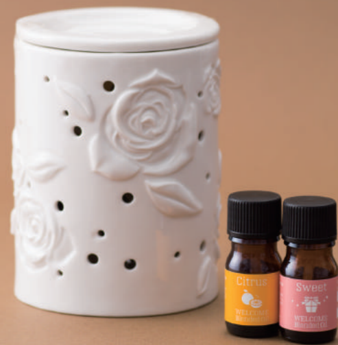
アロマランプ M ギフトセット

ハーブが初めての方でもおいしく楽しめるブレンドハーブティー。 フルーツやフレーバーを加えて飲みやすくブレンドしました。